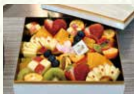
『フルーツおせち』 県産食材:各種県産果実 販売時期:3月下旬～4月末