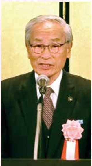
保坂武市長会会長(甲斐市長)