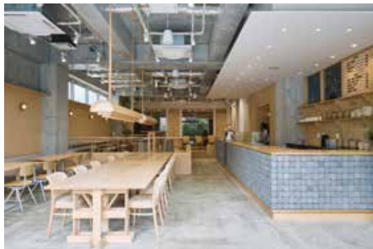
「カフェの中にあるオフィス」をコンセプトとした「社員みんなが集まりたい空間」を実現した最新オフィス（カフェ「moo」）