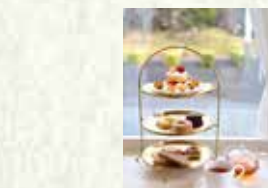
『季節の アフタヌーンティーセット』 県産食材:各種県産果実 販売時期:3月中旬～

山梨県立博物館カフェ「Museum café Sweet's lab 葡萄屋 kofu」で、季節の県産果実を使った新メニューが登場。春の訪れを感じながら、旬の果実を活かした絶品スイーツをお楽しみください。