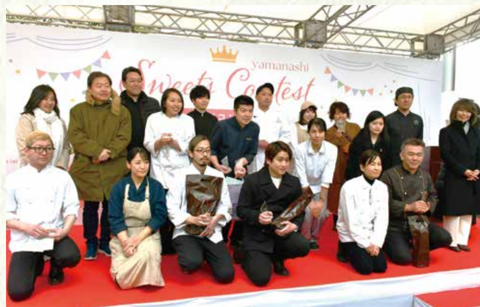
【各部門の最優秀賞】