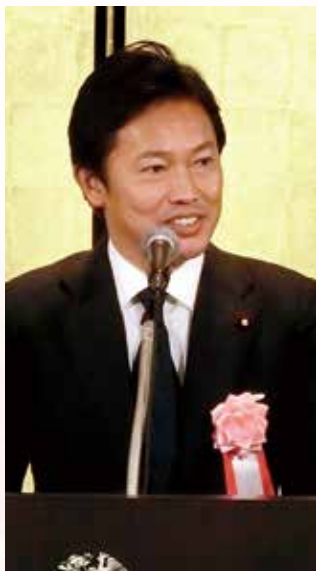
中谷真一衆議院議員