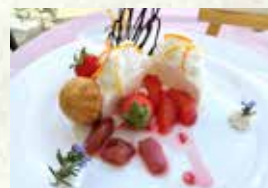
『クレームダンジュ』 県産食材:山梨市のレモン、 富士河口湖町のクラフトチーズ 販売時期:4月上旬～