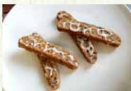
『柚子のビスコッティ』 県産食材:富士川町のユズ、山梨 県忍野村のそば粉 販売時期:2月上旬～