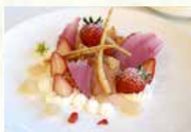
『イチゴのミルフィーユ』 県産食材:甲府市のイチゴ 販売時期:4月上旬～