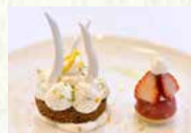
『ゆずのアシェットデセール』 県産食材:富士川町のユズ 販売時期:2月上旬～4月中旬